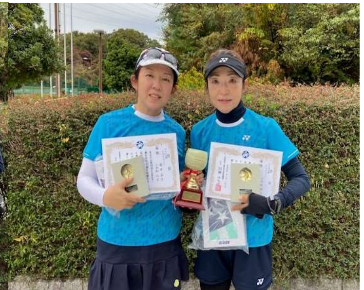
◇OV100Plus女子ダブルス 優勝◇