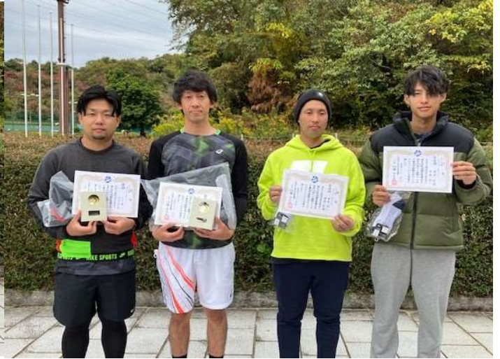
◇一般男子ダブルス2位T 優勝・準優勝◇