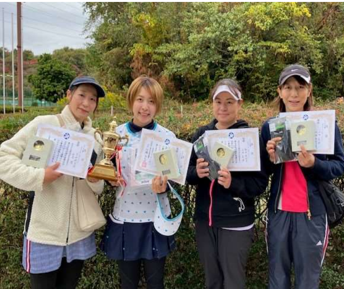
◇一般女子ダブルス1位T 優勝・準優勝◇