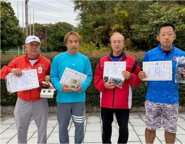
◇OV100Plus男子ダブルス1位T 優勝・準優勝◇