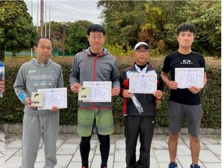
◇OV100Plus男子ダブルス2位T 優勝・準優勝◇