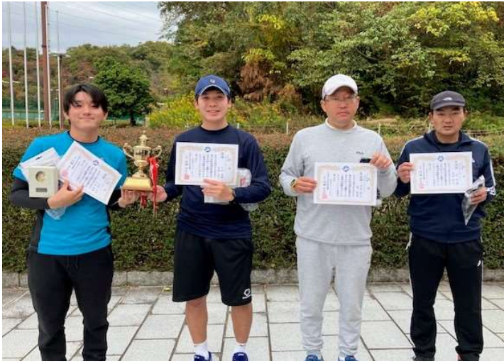
◇一般男子ダブルス1位T 優勝・準優勝◇